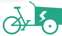
VÉLO CARGO (À ASSISTANCE ÉLECTRIQUE)

NEUF : Jusqu'à 300€ OCCASION : Jusqu'à 150€