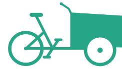
VÉLO CARGO CLASSIQUE

NEUF : Jusqu'à 400€ OCCASION : Jusqu'à 200€