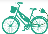
VÉLO À ASSISTANCE ÉLECTRIQUE (HORS VTT, COURSE ET BMX)

NEUF : Jusqu'à 150€ OCCASION : Jusqu'à 100€